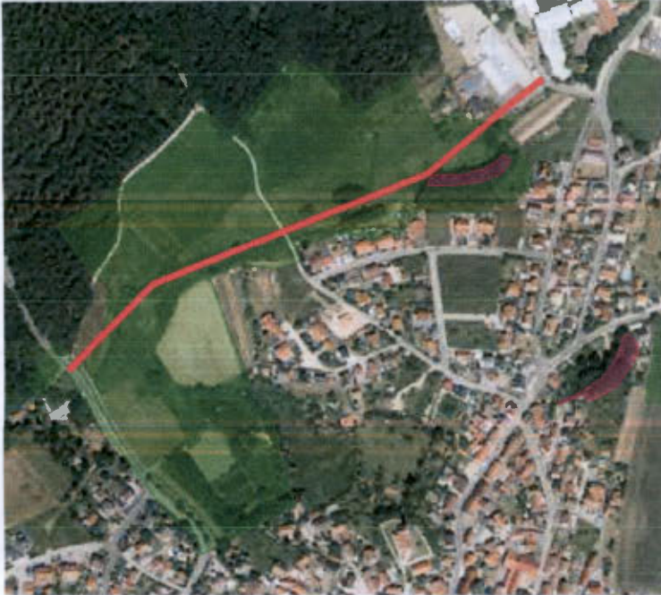
Anhang: Karte mit Schutzgebieten

grün schraffiert: Landschaftsschutzgebiet